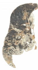
じん肺に罹患した肺

主に小さな土ぼこりや金属の粒などの粉じんを長年吸い込むことで、肺の組織が線維化し、硬くなってしまふ病気で、根本的な治療がありません。